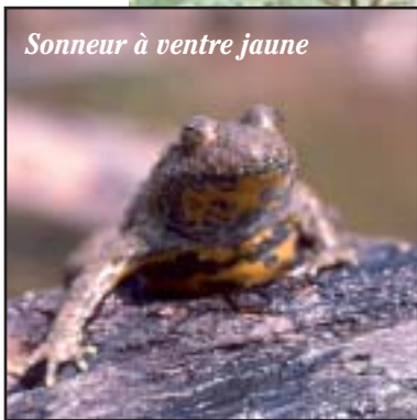
Sonneur à ventre jaune