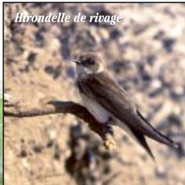
Hirondelle de rivage