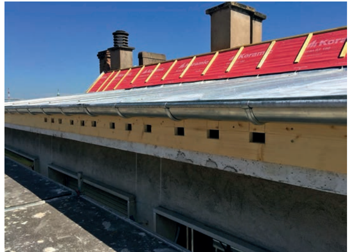
Le service Médiation Faune Sauvage aide à favoriser la cohabitation homme-animal. Ici : intégration de nids à martinets noirs