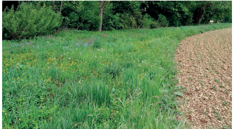
Bordures de champs enherbées et fleuries, au coeur des projets Fermes bio&Biodiversité