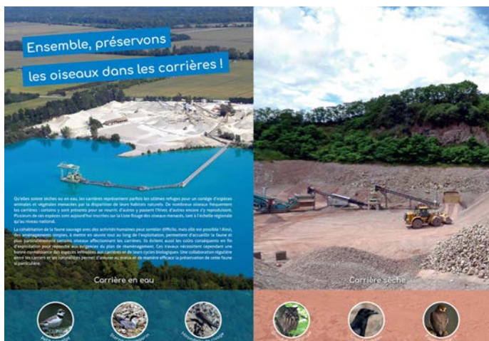
Edition d'une nouvelle plaquette relative à la protection de l'avifaune dans les carrières