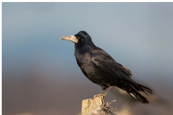
Le corbeau freux, choisi comme Oiseau de l'année en 2018